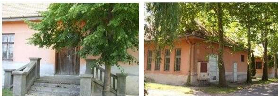
„A hídon túl”