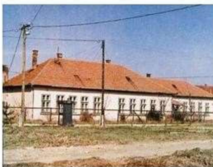
A békéscsabai szakképző kihelyezett tagozata a Vörösmarty utcában

Az igény azonban továbbra is jelentkezett a szakemberképzésre, s átadásra kerülhetett 1994ben az új iskola, mely a szakképzés szeghalmi bázisa lett. Az oktatáspolitikai változások azonban ismét összekapcsolták a két iskolaalapító szándékát, 1999-ben összevonásra került a Péter András Gimnázium és a Szigeti Endre Szakképző Iskola. A legújabb változások a szakképzés megfelelő irányítása érdekében ismét átrendezték az iskolaszervezetet a városban, és így iskolánk 2015. július 1-jétől a Gyulai Szakképzési Centrum részeként működik tovább, s ennek megfelelően fő profilja ismét a szakképzés, valamint az érettségire épülő szakmai oktatás lett.